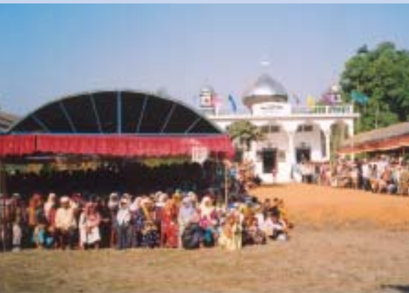
Masjid Nikmatul - Islam Thol Por, Stoeng Trang

Perasmian Masjid merupakan budaya umat Islam Kemboja untuk mengembangkan syiar Islam dalam negara yang bilangan umat Islamnya hanya 5% daripada jumlah 13 juta rakyat Kemboja. Tiga buah masjid telah dirasmikan pada hari-hari Raya Korban Eidul Adha tahun ini.