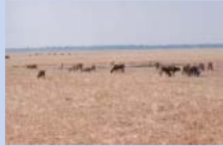
Kemarau di Kemboja

Setiap tahun, Kemboja menghadapi musim kemarau yang boleh berlanjutan antara 4 hingga 6 bulan lamanya. Sistem bekalan air berpaip masih belum dapat disusun dengan baik dan bekalan air paip di kampung-kampung boleh dikatakan tidak wujud. Orang-orang kampung bergantung harap kepada air sungai, kolam ataupun perigi untuk keperluan air seharian.