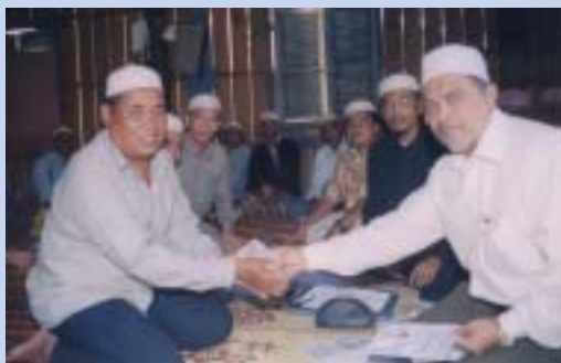
Sumbangan dari Malaysia

Untuk mendapatkan keberkatan bulan Ramadhan 5% yuran penyertaan program Korban & Aqiqah yang diterima sebelum 25 Ramadhan 1425H bersamaan 8 November 2004 diperuntukkan untuk Program Berbuka Puasa di Kemboja.