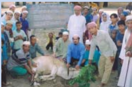
Lembu korban Mufti Johor sedang disempurnakan

Pada tahun ini, Badan Kebajikan Islam Telekom Malaysia (BAKIT) dan kakitangan Jabatan Mufti Johor telah menganjurkan program Korban Eidhul Adha di Kemboja yang diuruskan oleh Al-Ameen Serve Holdings Sdn. Bhd.