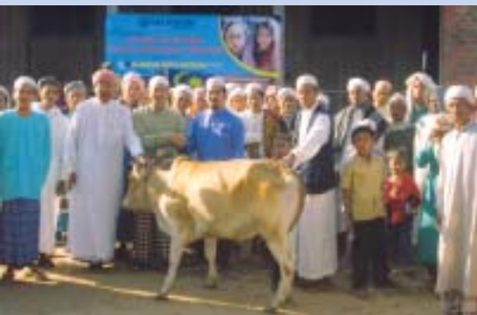
Perasmian ibadah korban berkelompok di Masjid Chumnik, Krochmar