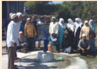
Hanya RM380 untuk telaga pam yang disumbangkan oleh peserta korban dan aqiqah dari Malaysia.