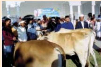
Lembu dari ibadah korban berkelompok juga disempurnakan pada perasmian Program Korban Eidul Adha & Aqiqah.