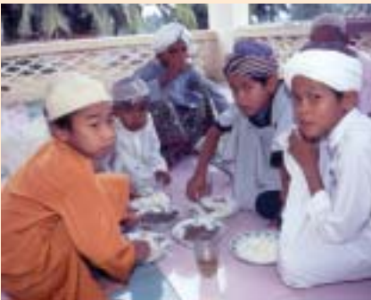
Anak-anak kecil sedang menikmati jamuan aqiqah di Battambang.

“ Sesungguhnya rahmat Allah sangat dekat kepada orang yang berbuat baik.” maksud al-A'raf : 56