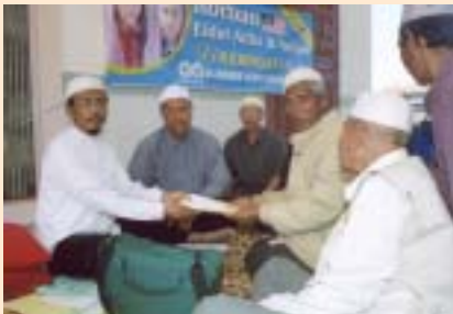
Penyerahan sijil korban dan wang untuk pembelian lembu kepada imam-imam masjid di Prek Bak, Kampong Cham.

Pengerusi Program Eidul Adha & Aqiqah Di Kemboja 1426H