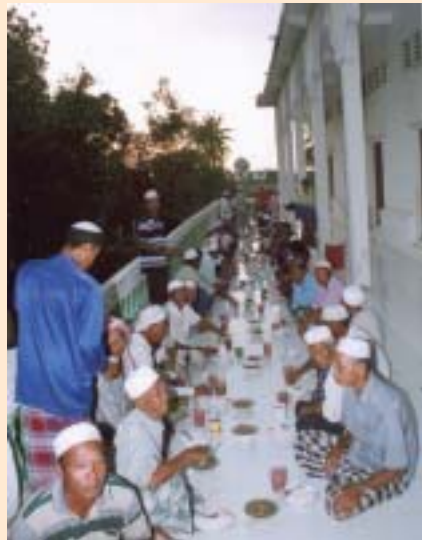
Jamuan aqiqah juga disempurnakan pada bulan Ramadhan di masjid ar-Rahmani, Chruoy Metrey Leu, Wilayah Kandal.