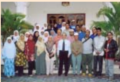
Ziarah hormat peserta dari Malaysia ke Kedutaan Malaysia, Phnom Penh, Kemboja.

Salinan laporan kepada Kedutaan Malaysia juga dihantar kepada Ketua Pengarah Jabatan Kemajuan Islam Malaysia (JAKIM), Putrajaya.