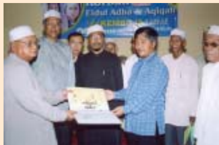
Penyampaian sijil-sijil korban dan aqiqah oleh Penasihat Perdana Menteri Kemboja kepada imam wilayah Kandal.