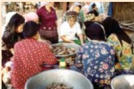
Semangat gotong-royong masih kuat di kalangan umat Islam di Kemboja.

“Tiap-tiap sesuatu ada kuncinya, dan kunci syurga itu adalah mengasihi fakir miskin” maksud hadith