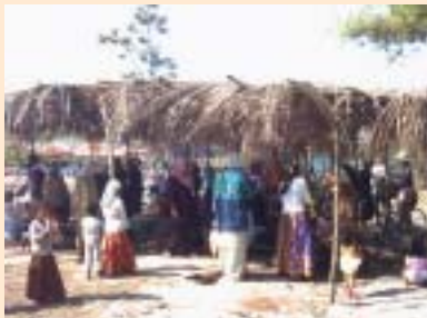
Gotong royong penduduk kampung bagi perasmian masjid at-Taqwa, Kampong Chhnang.