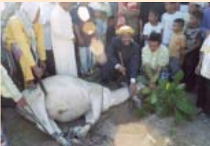
Mufti Kerajaan Kemboja pada Hari Raya Eidul Adha.

“Tidak ada suatu amalan yang paling dicintai oleh Allah daripada Bani Adam ketika Hari Raya Eidul Adha selain menyembelih haiwan korban” maksud hadith