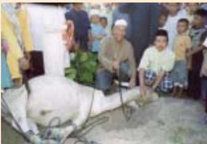
Penyembelihan korban di perkarangan masjid al-Makmur, Kompong Chhnang.

“Bermurah hatilah kamu terhadap orang-orang di bumi agar yang di langit bermurah hati denganmu.” maksud hadith