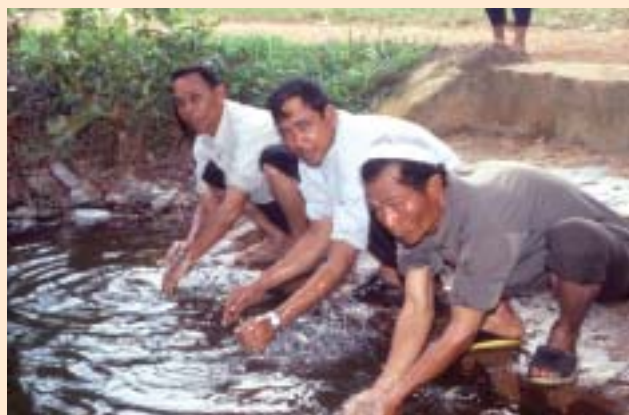
Mengambil wuduk di kolam masjid wilayah Kampot

Lembu yang telah dibeli hendaklah disimpan di tempat yang selamat, diberi makan dan minum yang secukupnya, dijaga kesihatannya dan tidak digunakan untuk kerja-kerja.