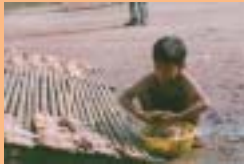
Anak kecil menjemur ikan kering

“Bermurah hatilah kamu terhadap orang-orang di bumi agar yang di langit bermurah hati kepadamu” maksud hadith